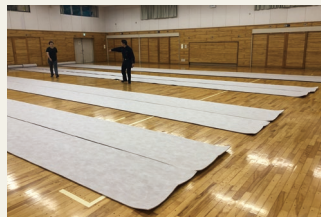
浅間中学校自主避難所の様子