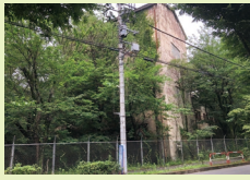
府中基地跡地留保地