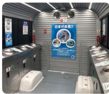
協力: 浜松市ビッグウェーブホールディングス(株)

ラグビーW杯のパブリックビューイングと府中ナイトピアガーデンにて、受動喫煙を防ぐための市の取り組みとして全国の自治体で初めて分煙バスが導入されました! 12月2日から開会される第四回定例会で「分煙に対する市の取組と分煙バス導入と評価」について一般質問をさせていただきます。