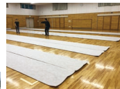
浅間中学校自主避難所の様子